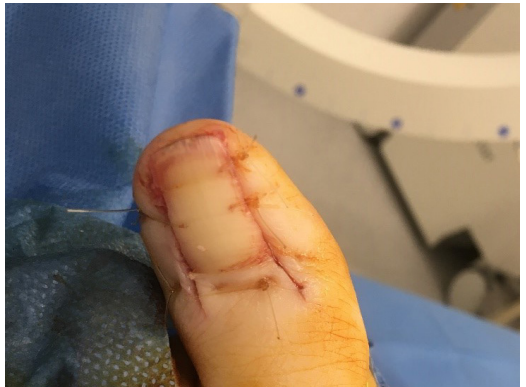
na de ingreep