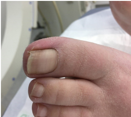
voor de ingreep

Wanneer er een infectie is onder de nagelwal wordt er in twee fases gewerkt. Eerst wordt een deel van de nagel verwijderd om de infectie met lokale wondzorg en eventueel antibiotica onder controle te krijgen. Nadat de infectie verdwenen is, zal de arts beslissen over een definitieve behandeling.