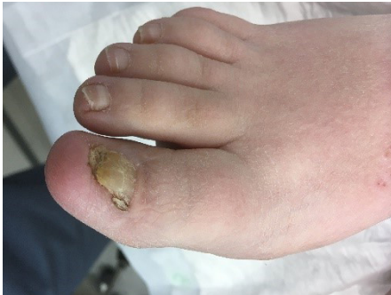
voor de ingreep

Soms moet de nagel permanent verwijderd worden. De arts kan kiezen voor deze ingreep wanneer er sprake is van een therapieresistente schimmelnagel, scheefgroeïende nagel of wanneer er eerder al een Winogradprocedure uitgevoerd werd. Bij deze techniek zal de arts de nagel volledig wegnemen waarbij de nagelmatrix ook verwijderd wordt. Daardoor zal de nagel niet meer kunnen teruggroeien. Het nagelbed zal na de ingreep zichtbaar zijn.