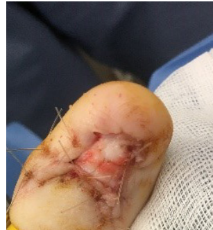
na de ingreep

Postoperatief is dagelijkse wondzorg noodzakelijk tot de controleraadpleging. Zwelling en pijn kunnen een tijdje aanwezig zijn. Het kan soms tot drie weken na de ingreep duren voordat de patiënt terug een gewone schoen kan dragen.