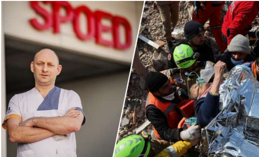
B-FAST-missie in Turkije