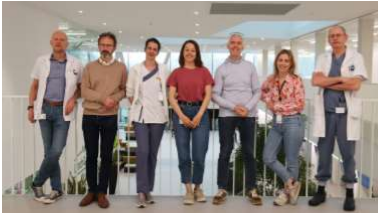
Leden team obesitascentrum