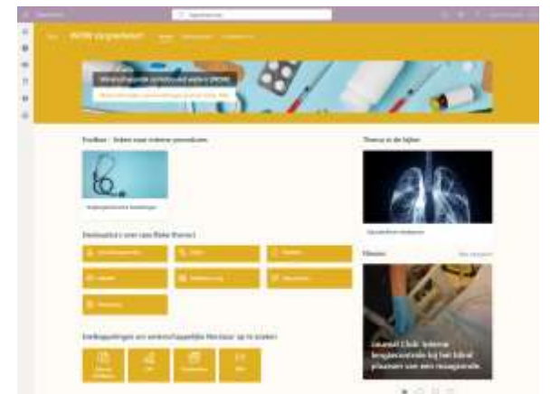
WOW-portaalsite voor zorgverleners