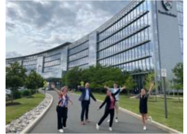
Bezoek bij Magnet4Europe-partnerziekenhuizen in de VS