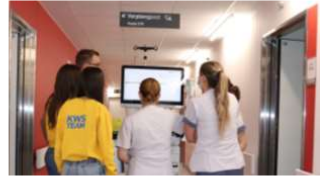
Uitrol Elektronisch Medicatievoorschrift