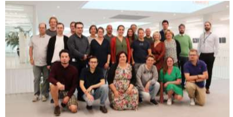
ICT AZ Sint-Maarten