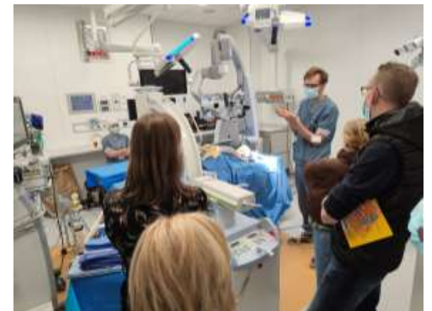
Dag van de Zorg